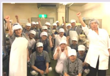
おいしい給食をつくります！

セントラルキッチンとは、星ヶ丘病院をはじめ、隣接する介護老人保健施設オリオンや、星ヶ丘保育園の3施設の給食提供を行う施設です。これまでは一部別々に、調理を行っていましたが一カ所に集約し業務の効率化を図ることにより最大520食の給食提供が可能となりました。最新調理機器の導入により、これまで以上に衛生的な調理が出来るほか、品質の均一化や調理時間の短縮等、よりおいしくなった食事の提供が可能となりました。今後は、今まで提供が難しかった保育園園児向けに手作りのおやつも提供する予定です。