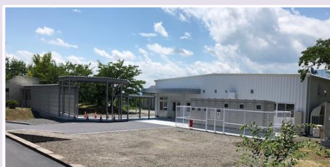
病院南側に完成したセントラルキッチン