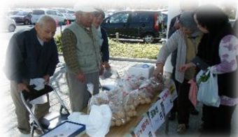
星総合病院の青空市に出店しました