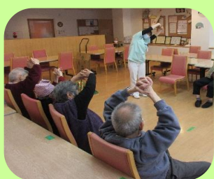
まずは入念に 準備体操♪

敬老園には様々なクラブ活動があり、 入園者の皆さんがそれぞれ 好きなクラブに所属しています。