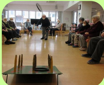
皆に見守られながら輪投げ開始！