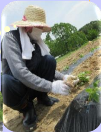
1本1本丁寧に 植えました！！