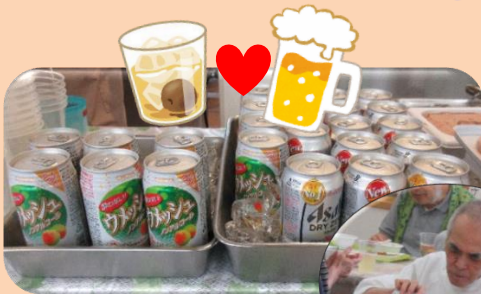
『ノンアルでも 梅酒は最高～！！』