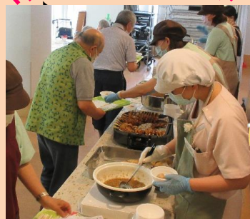
『出来たてで美味しい～！！』