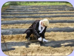
マルチに穴を 開けていきます！