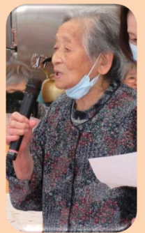
『夏といったら これこれ～！！』