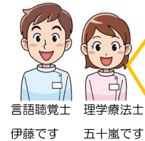
言語聴覚士 伊藤です 理学療法士 五十嵐です