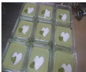
ホワイトチョコと 抹茶のムース