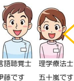
言語聴覚士 伊藤です 理学療法士 五十嵐です