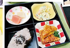
季節感や行事の楽しさを感じられる食事の提供

利用者さんご家族の気持ちに寄り添い、支援相談員が最善のご提案をします。退所前や退所後も専門職と連携し、安心して在宅生活が送れるようサポートします。