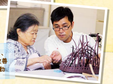
趣味活動を再獲得し、認知機能を維持・改善するための作業活動