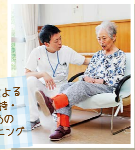
理学療法士による運動機能維持・改善のための筋力トレーニング

医師の指示を受けた専門のリハビリスタッフが利用者さんやご家族に確認しながら、身体の状態に合った個別リハビリプログラムを計画します。多職種と連携して日常生活の中でもリハビリを行い、自分らしい生活が送れるよう支援します。