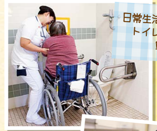
日常生活動作改善のためトイレでの実践的な動作練習