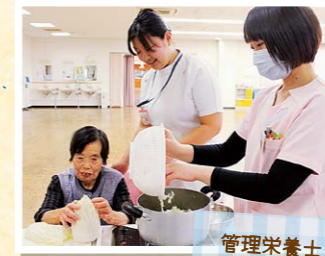
管理栄養士と連携し、在宅復帰後の調理方法の指導や動作の練習