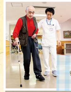
安全に歩行できる歩行補助具の選定と歩行練習