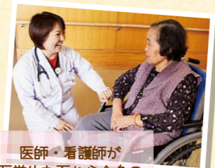
医師・看護師が医学的な面から全身の健康管理をサポート

介護・医療の必要な方の在宅復帰のために、1人1人のケアプランに沿った様々なサービスを提供します。