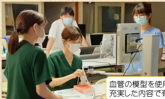
血管の模型を使用し、穿刺の練習をします。充実した内容で有意義な講習でした♪