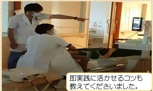
即実践に活かせるコツも教えてくださいました。