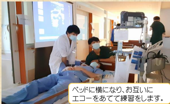
ベッドに横になり、お互いにエコーをあてて練習をします。