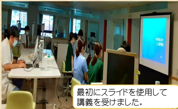
最初にスライドを使用して講義を受けました。