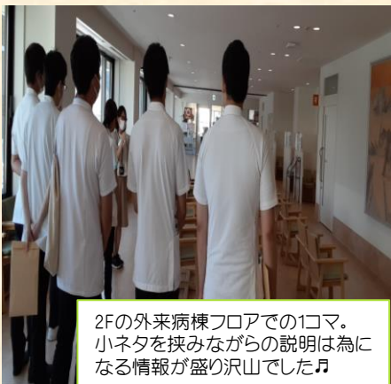
2Fの外来病棟フロアでの1コマ。小ネタを挟みながらの説明は気になる情報が盛り沢山でした♪