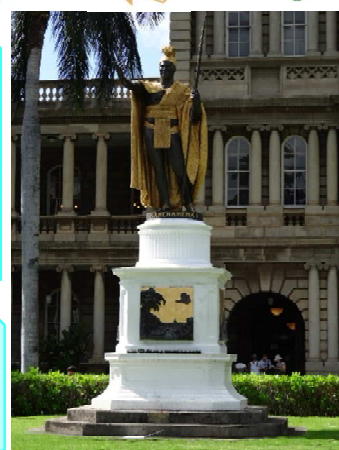
カメハメハ大王像→