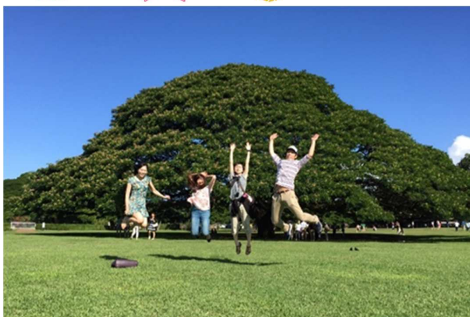
←Moanalua Gardens 某CMでお馴染みの木