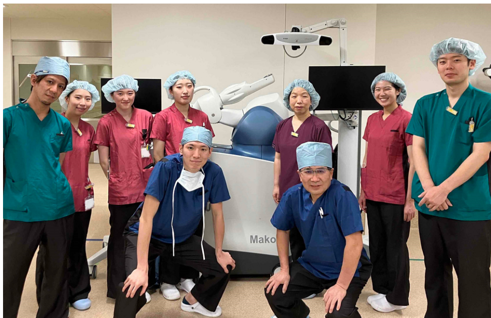
手術支援ロボット「Mako」とスタッフ

令和4年2月に導入した人工股関節の手術支援ロボット「Mako」を使用した手術が、去る12月に200関節に到達しました。これも信頼して受診して下さった患者さん、ご支援いただいたクリニックの先生や病院スタッフの皆様のおかげです。心より感謝申し上げます。