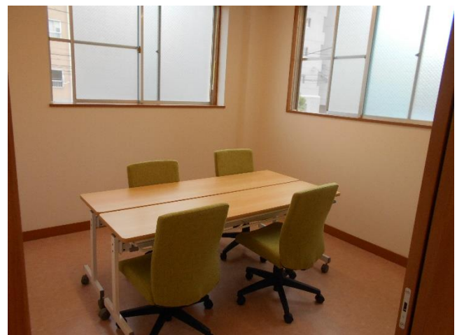
相談室(2F) 個別学習などにも使えます