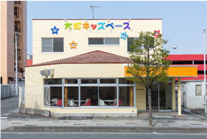
正面風景 リフォームして4月4日に開所しました