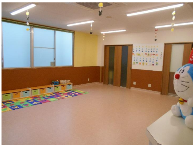
保育室(1F) 小さな子どもとも遊べます

二階の活動スペース 47・45㎡ (机7、椅子20、ロッカー3) (いつでもミニエがながります)