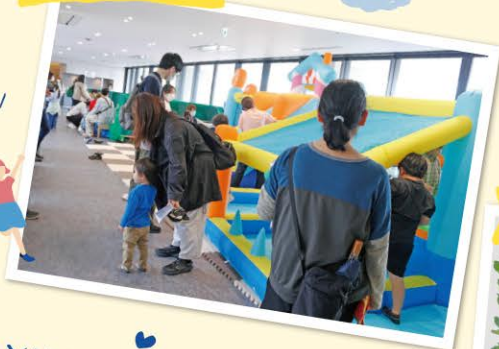
キッズプレイエリア (大型遊具)

おおまちてらすは、これからも世代を超えて楽しめるイベントを企画し、地域の皆さまに愛される施設づくりを進めてまいります。今後の取り組みにどうぞご期待ください。