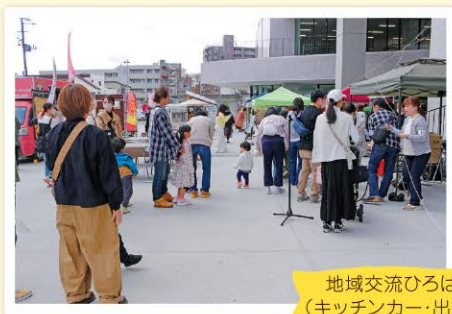
地域交流ひろば (キッチンカー・出店)