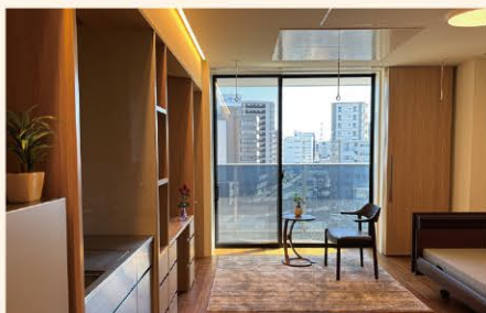
居室（シングルルーム）