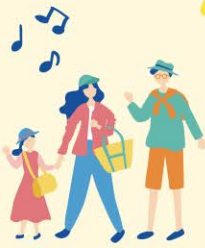
こどもフロア (ワークショップ)