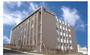
寿泉堂香久山病院