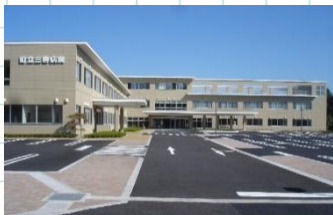
三春町立三春病院